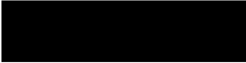
Netzgesellschaft Gütersloh mbH Leiter Netzwirtschaft