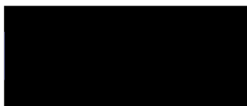
Fachbereichsleiterin Netzkunden- und Energiedatenmanagement